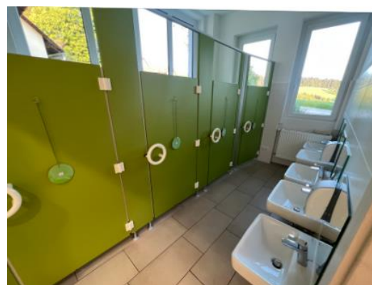
WC - Anlagen