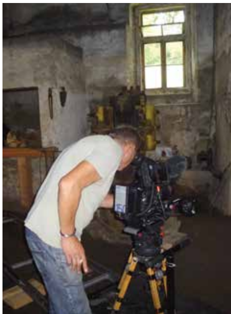
Foto: Dreharbeiten im Hammerwerk

Das Hammerwerk Roob durfte dabei mitwirken und seinen Teil dazu beitragen, was eine besondere Wertschätzung und Auszeichnung für dieses Kulturdenkmal ist!