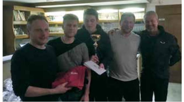
Foto: Der Gruppenerste am Nachmittag und Gemeindegewinner wurde Tischlerei Hutter

Die Erstplatzierten der jeweiligen Gruppe ritterten um den Tages-sieg.