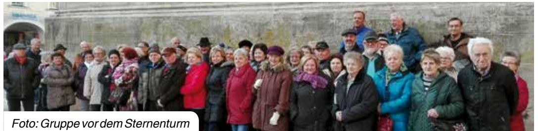
Foto: Gruppe vor dem Sternenturm