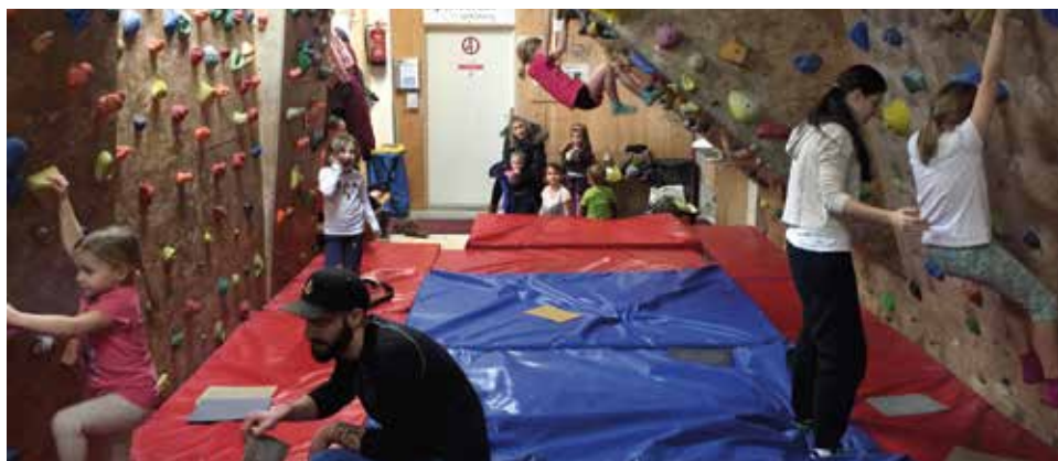
Foto: Bouldern mit Kids in der Kletterhalle Lobming