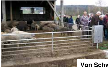
Von Schwein bis Wein

Nach soviel Wollschweinerie ging es anschließend in den Weinkeller, wo in riesigen Tanks feinsten Rebensaft, der aus Trauben vom Rebstock in basalt-haltiger Vulkanerde stammt, verarbeitet und in riesigen Stahltanks, großen Holzfässern oder kleineren Baric-Fässern gelagert wird. Das Herzstück war ein auf der Maische vergorener und in Basaltstein gereifter Wein. Es ist für einen „Otto Normalverbraucher“ fast unvorstellbar, dass ein in Basalttrögen gereifter Wein eine solch charakterstarke, einmalige Qualität besitzt. Schlussendlich durfte die Verkostung von „Schwein und Wein“ nicht fehlen, wo der hauchdünn aufgeschnittene Speck mit einem Schluck Grauburgunder für wahre Gaumenfreude sorgte.