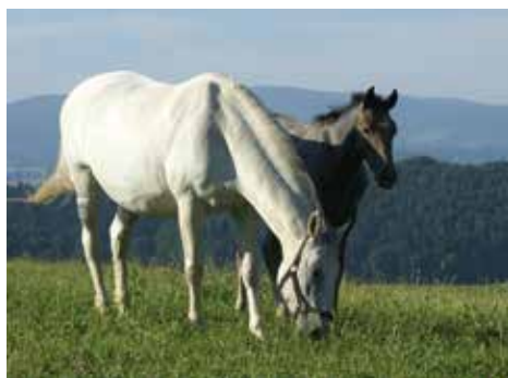
Foto: Lipizzanergestüt Piber_Mutterstute mit Fohlen Wiese